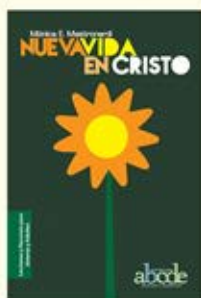
Nueva Vida en Cristo