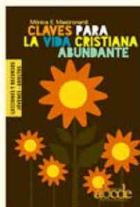
Claves para la Vida Cristiana Abundante