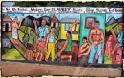
Un mural en el África Occidental alerta a los residentes de una comunidad acerca de la trata de personas.

No contaminarás a tu hija haciéndola fornicar, Para que no se prostituya la tierra Y se llene de maldad. ~ Levítico 19:29 ~